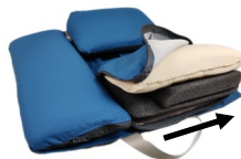
fig.3: modalità inserimento elementi