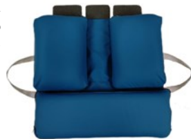
fig.1: modalità estesa

Estrarre il cuscino dalla confezione e adagiarlo sulla base di appoggio (fig.1: modalità estesa); è ora possibile regolare gli elementi modulari, compresi gli elementi presenti al loro interno, secondo le proprie necessità, facendo attenzione a non avvicinare troppo tra loro, quelli della zona posteriore del cuscino per evitare che la funzionalità del cuscino venga meno (vedere nella sezione manutenzione ordinaria come posizionare correttamente gli elementi).