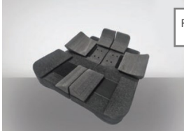
Fig. 1: Kit Pre-assemblato

In alternativa, la messa in servizio dell'unità posturale Inserto Seat Impulso , priva o modificata anche parzialmente della integrità di design ed interezza numerica e dimensionale di componenti in dotazione, approntata e costruita secondo la prescrizione scritta da parte dell'operatore professionale in funzione dell'anatomia/ morfologia/ deformità dell'utilizzatore attraverso rilievo delle sue misure e prove dirette, è riferibile a quella di un dispositivo fabbricato su misura.