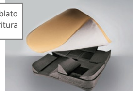
Fig. 3: Kit Pre-assemblato + Kit imbottitura