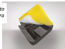
Fig. 3: Kit pre-assemblato + Kit Imbottitura