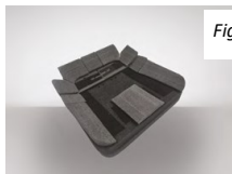
Fig. 1: Kit pre-assemblato