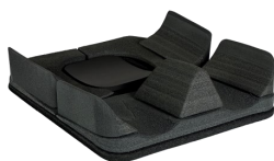
Fig. 1: Kit Pre-assemblato