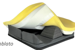
Fig. 3: Kit Pre-assemblato + Kit imbottitura