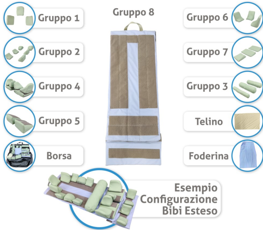
Immagine prodotto: le immagini sono puramente illustrative