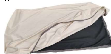
Foderina di copertura totale con zip